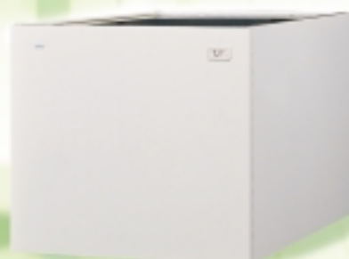
"BT 150" abbinabile con apposito kit alle caldaie LOGO e MISTRAL solo riscaldamento