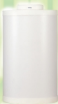
"BT 100" abbinabile con apposito kit alle caldaie PLANET BFT e PLANET DEWY BFT