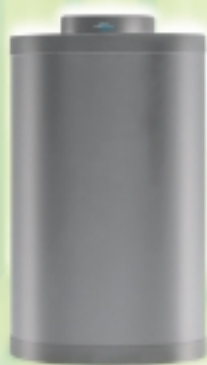
"BA 100/150/200" abbinabile alle caldaie a gasolio (ESTELLE-1R- 2R-SOLO) e gas (RX)

I bollitori ad accumulo BA , della capacità di 100, 150 e 200 litri sono abbinabili alle caldaie a basamento a gas e gasolio per il solo riscaldamento RX , RX BF , Estelle , 1R , 2R e al gruppo termico Solo e vengono collocati solitamente a lato della caldaia.