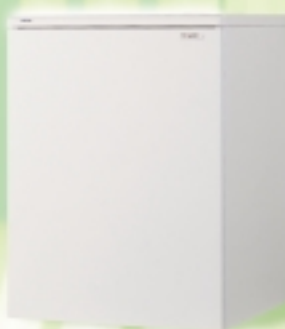
"BT 130" abbinabile con apposito kit alle caldaie LOGO e MISTRAL solo riscaldamento