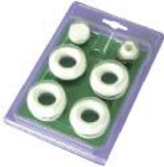
KIT RIDUZIONE CON GUARNIZIONI IN SILICONE BIANCO, AVORIO O CROMATO 44- 3/8" per radiatori da 900 a 2000 mm, Junior 47- 1/2" per radiatori da 900 a 2000 mm, Junior 49- 3/4" per radiatori da 900 a 2000 mm, Junior