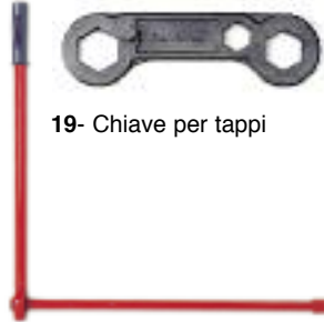
19- Chiave per tappi