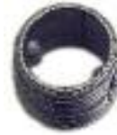
9- Nipples 1"

colori standard: | colori speciali: vedi cartella colore