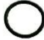
24- Guarnizione "O-RING" per radiatori Oscar, Junior, Ekos Plus