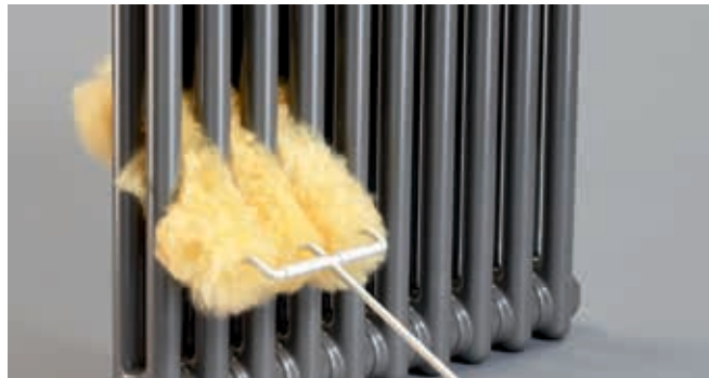
Zehnder Spazzola in pelo di agnello

V20161125, RAD_DAS, IT_it, con riserva di modifiche