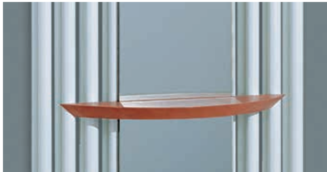
Tavolino in legno di faggio massiccio verniciato opaco