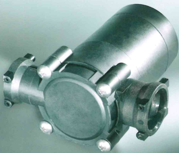
Turbina per idroaccensione