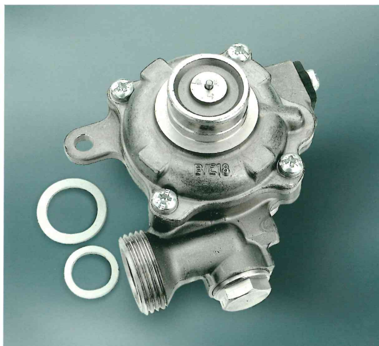
Gruppo acqua in ottone

Accensione elettronica significa risparmio effettivo (circa 50 Euro all'anno sulla bolletta) e minor deposito di calcare nella serpentina dello scambiatore.