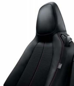
008 TESSUTO (124 SPIDER)