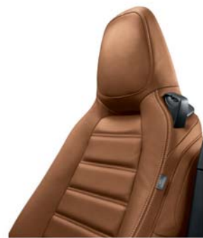
470 - PELLE TABACCO (LUSO)