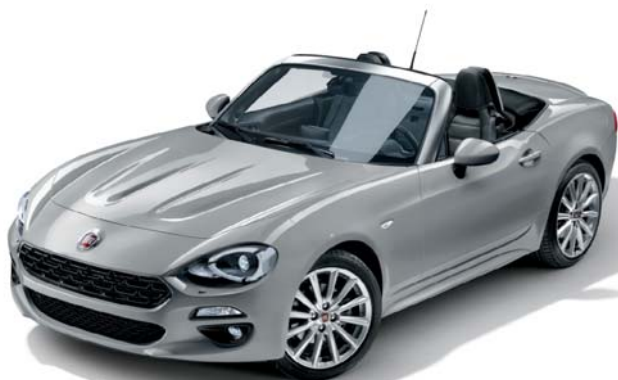
5CD GRIGIO ARGENTO - METALLIZZATO