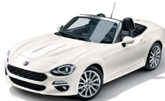
802 BIANCO GHIACCIO - TRISTRATO