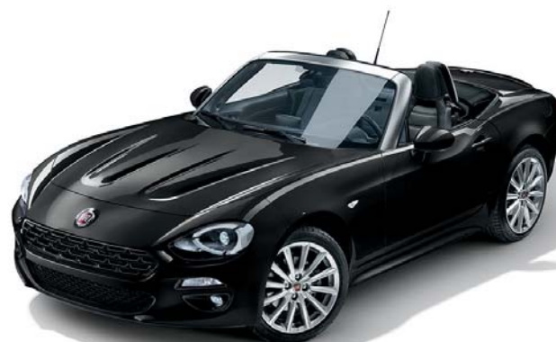
5DN NERO VESUVIO - METALLIZZATO