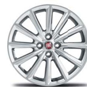
CERCHI IN LEGA 17" (LUSO / ANNIVERSARY)