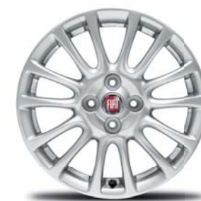
CERCHI IN LEGA 16" (124 SPIDER)