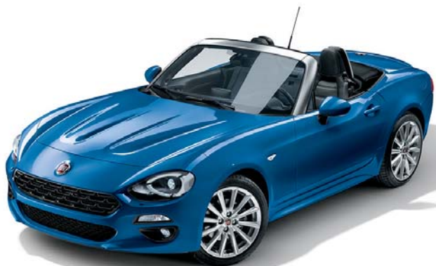
5CC AZZURRO ITALIA - METALLIZZATO