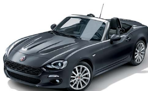
5CE GRIGIO MODA - METALLIZZATO