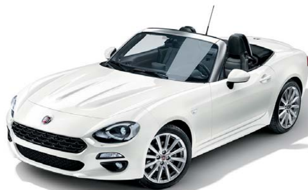
5CB BIANCO GELATO - PASTELLO