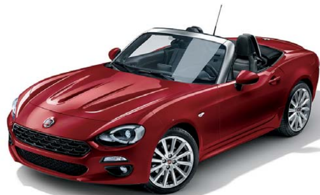
5CA ROSSO PASSIONE - PASTELLO

OGNI PARTICOLARE DELLA NUOVA FIAT 124 SPIDER È STATO PENSATO PER FARSI NOTARE. QUESTA BRILLANTE ROADSTER È DISPONIBILE IN OTTO COLORI DIFFERENTI E HA CERCHI IN LEGA DA 16" O 17" DAL DESIGN INCONFONDIBILE. MA SE IL SUO ASPETTO È ATTRAENTE, I DETTAGLI A BORDO DI 124 SPIDER SONO ANCORA PIÙ SEDUCENTI. NELLA VERSIONE LUSO, INFATTI, I SEDILI IN PELLE POSSONO ESSERE DI COLORE NERO O TABACCO. NON TI RESTA CHE SCEGLIERE E FARE VEDERE CHI SEI.