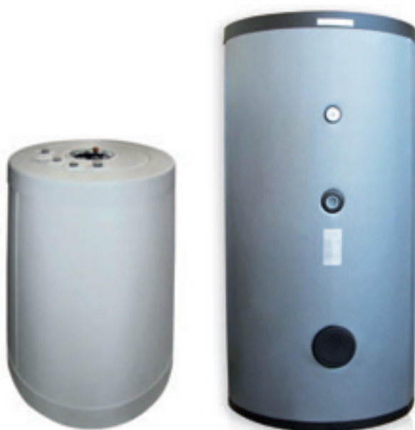
AQUATANK 120 USB

Bollitore in acciaio al carbonio vetrificato secondo normativa DIN 4753 dotato di singolo scambiatore fisso. L'isolante esterno è costituito da calotte in PU rigido amovibili e finitura con ABS colore grigio RAL 9006.