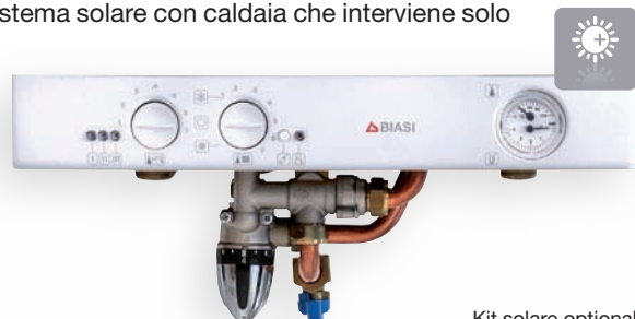
Kit solare optional

BASICA E può essere facilmente abbinata ad un sistema solare mediante il kit solare BIASI. Semplice ed immediato da installare, non necessita di parti elettriche e consente di ottimizzare l'integrazione del sistema solare con caldaia che interviene solo qualora necessario per garantire la temperatura di comfort richiesta.