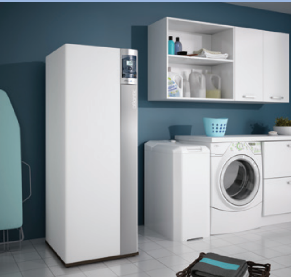
Effnox Condens Duo