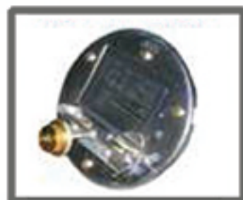
VALVOLA DI REGOLAZIONE DI TIRAGGIO COMBUSTION FLUE ADJUSTMENT VALVE