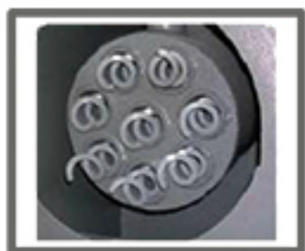
PULIZIA AUTOMATICA FASCIO TUBIERO AUTOMATIC CLEANING OF THE TUBE BUNDLE