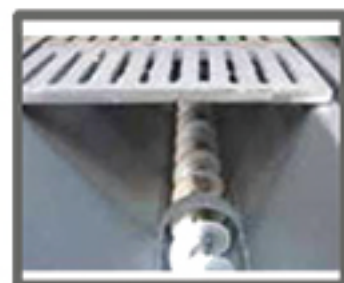
ESTRAZIONE AUTOMATICA DELLE CENERI AUTOMATIC EXTRACTION OF THE ASHES