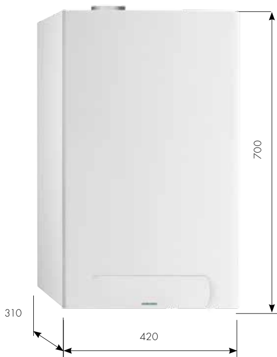
mod. BWA 24-35