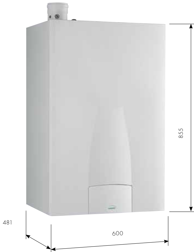
mod. BWA 24 B 60