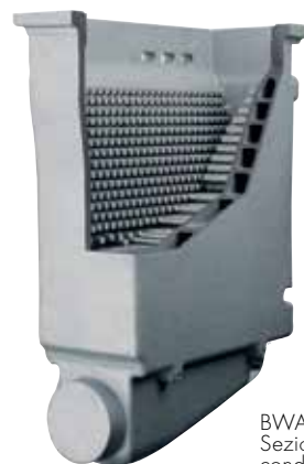
BWA24-35 Sezione scambiatore/ condensatore in Al/Si/Mg