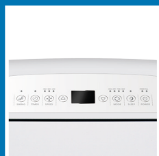
Pannello comandi digitale con display a LED Digital control panel with LED display

ARGO IRO and ARGO IRO PLUS are the portable air conditioners characterized by soft lines. Right compromise between space and shape, they are intuitive to use and easy to program thanks to their elegant control panel. They don't go unnoticed and they can easily adapt to any environment and style. With its heat pump, ARGO IRO PLUS is useful all year round.