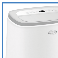
Cura dei dettagli Attention to details