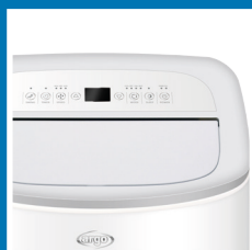
Flap motorizzato Auto-opening and swinging flap