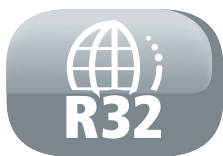
Gas refrigerante ecologico