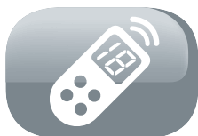
Telecomando display LCD