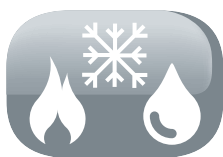
3 Funzioni in 1