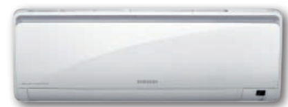
Unità interna universale