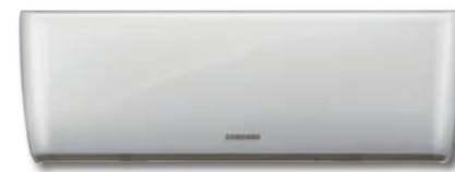
Unità interna universale