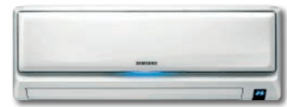
Unità interna universale