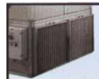
Pannello filtrante a cella piana rigenerabile.