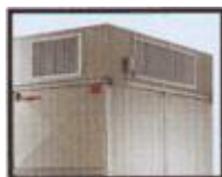
Testata pluridirezionale di distribuzione aria.