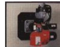
Brucciore a combustibile liquido o gassoso