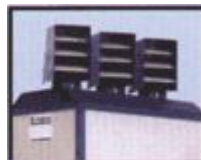
Torrini girevoli di distribuzione aria.