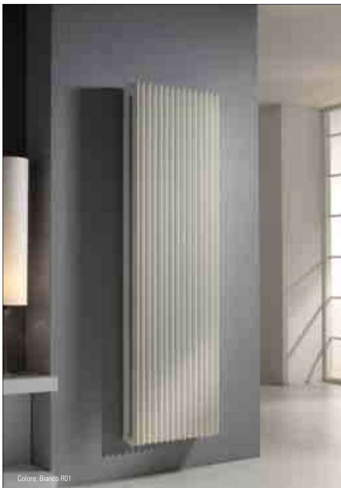
Colore: Bianco R01