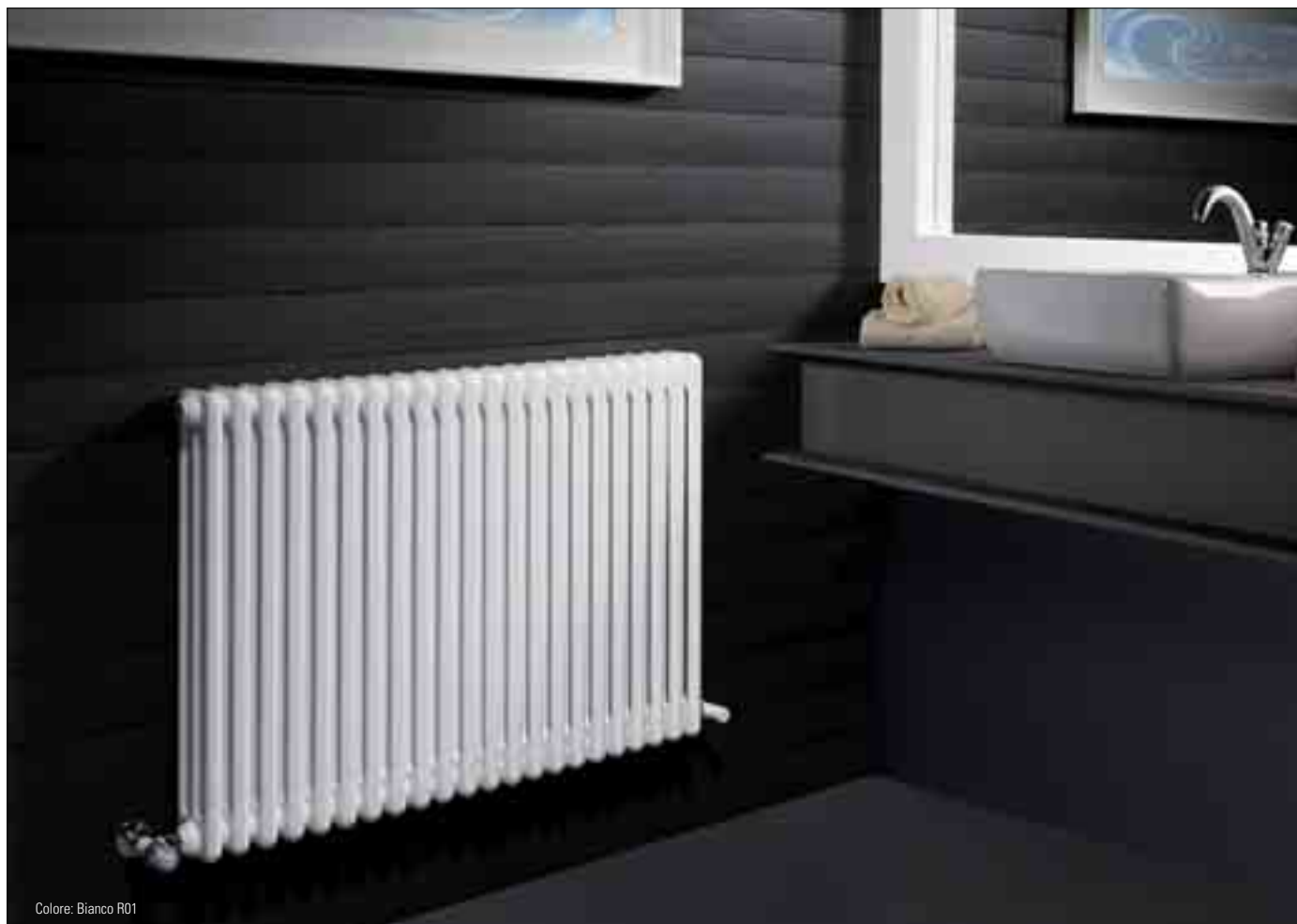
Colore: Bianco R01