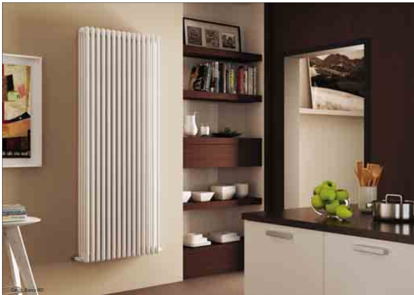
Colore: Bianco R01