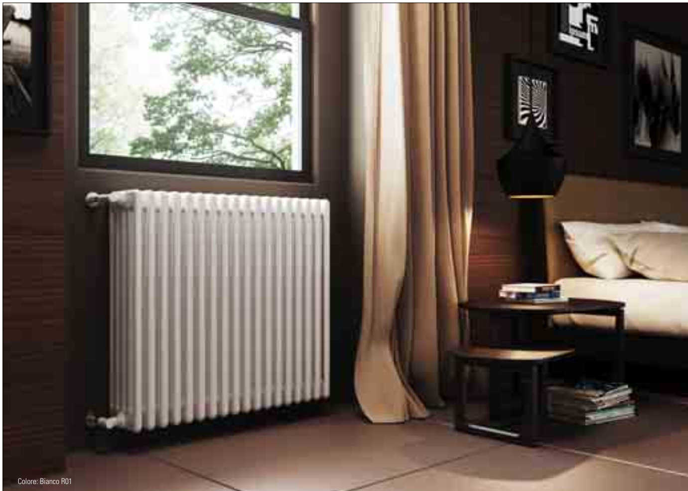
Colore: Bianco R01