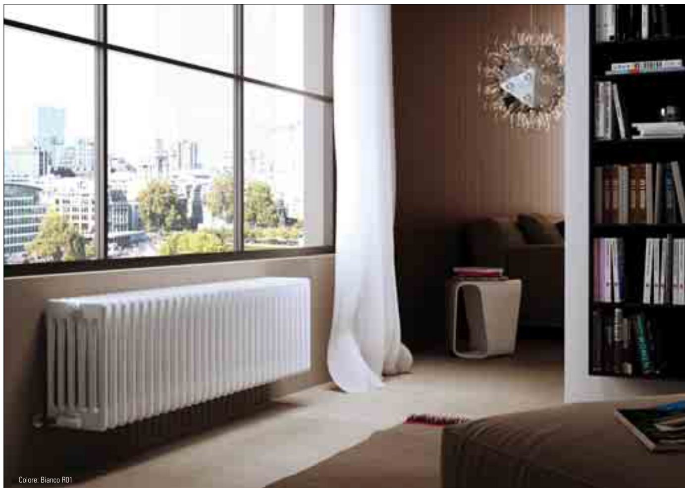
Colore: Bianco R01