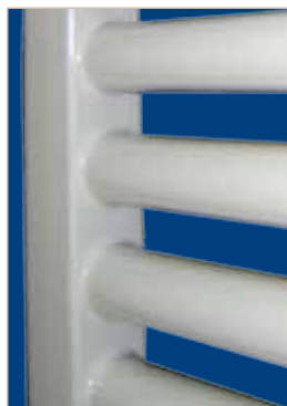
FINITURE IMPECCABILI ESTETICA DA PRIMATO