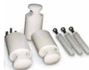
CON KIT DI FISSAGGIO MICROREGOLABILE GIÀ INCLUSO NELLA CONFEZIONE INSIEME ALLA VALVOLA SFILATO ARIA

ELEVATO DIAMETRO DEI TUBI EMISSIONE TERMICA ELEVATA ED ESTETICA OTTIMA