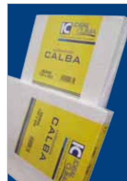
IN SCATOLA DI CARTONE IMBALLATO SINGOLARMENTE

Lo Scaldasalviette CALBA51 è lo scaldasalviette che coniuga la storica affidabilità tipica dei prodotti Ideal Clima alle più moderne tecnologie produttive. Ogni aspetto dei radiatori CALBA51 pone la qualità al primo posto. Ciascun tubo orizzontale, in acciaio al carbonio ad elevato spessore, viene prima "rivettato" all'interno del montante per una tenuta "a freddo". Successivamente ciascuno viene ulteriormente saldato per brasatura con leghe ecologiche ad alto tenore di rame per la seconda tenuta "a caldo". Il risultato è una affidabilità impareggiabile, garantita anche dal collaudo singolo al 100% a ben 13bar.