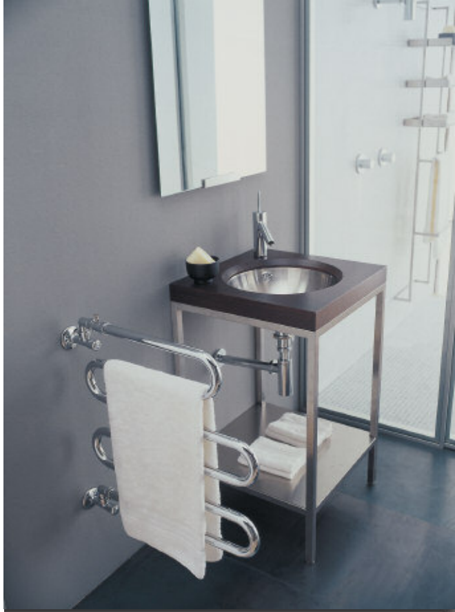
In foto: Radiatore Alatherm modello maxi colore Cromato (cod. 50).