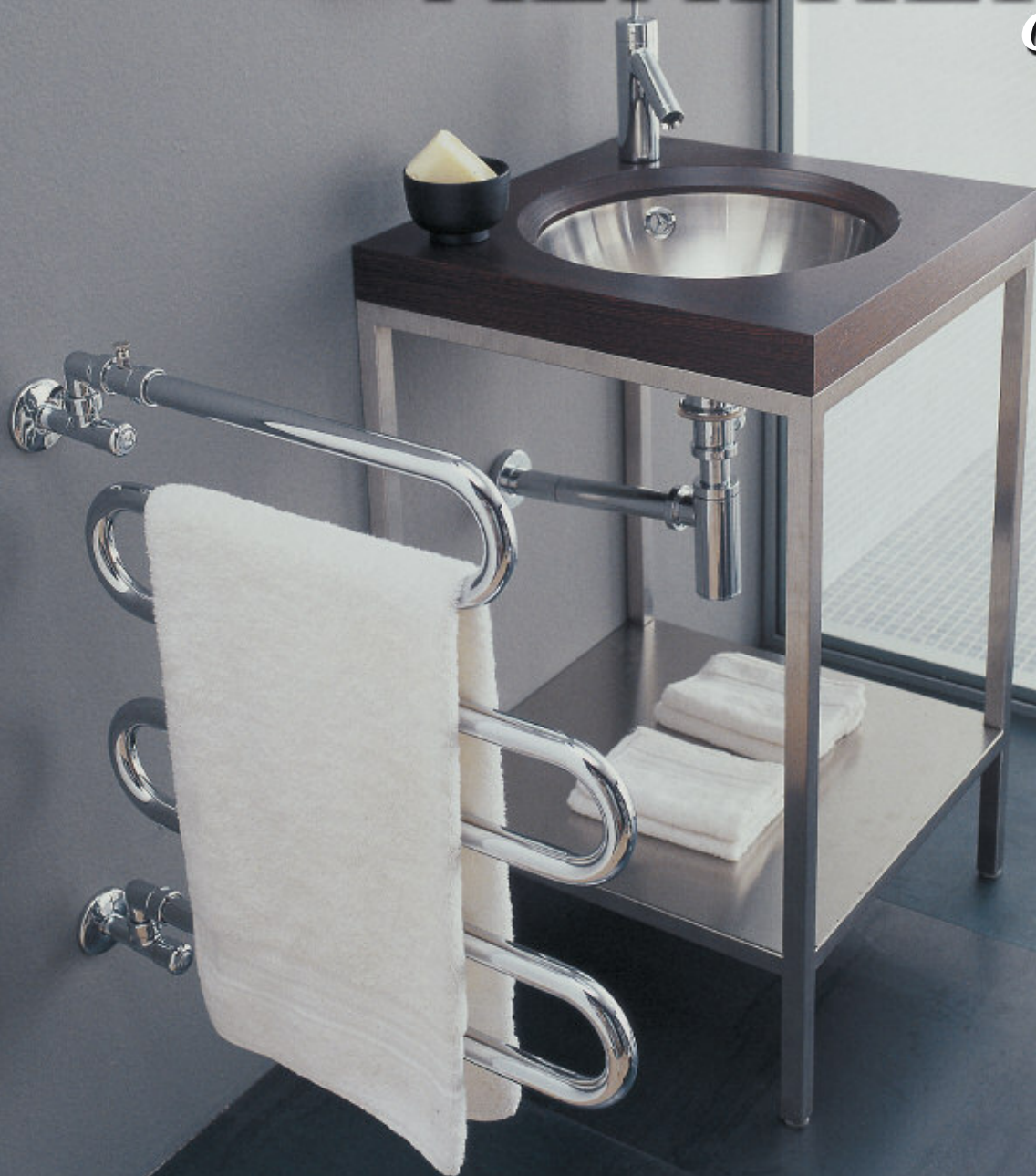
Radiatore Cromato (cod. 50)