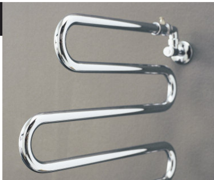
Radiatore Cromato (cod. 50)

Particolarmente studiato per bagni, cucine, lavanderie, riscalda piacevolmente asciugamani, teli da bagno ed altro. Può ruotare di 180° per cui, occupando pochissimo spazio, si adatta a molteplici esigenze di arredamento. E' realizzato in ottone cromato in due modelli. Dimensioni mm: 450xh325 e 550xh525.