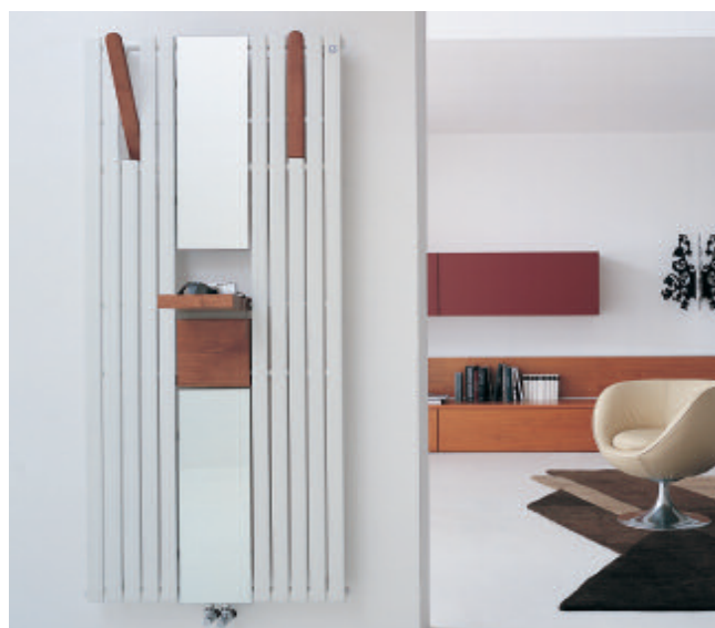
Radiatore verniciato colore Bianco Perla (cod. 16)

FLEXXO è disponibile nella selezione Colori Serie Special.