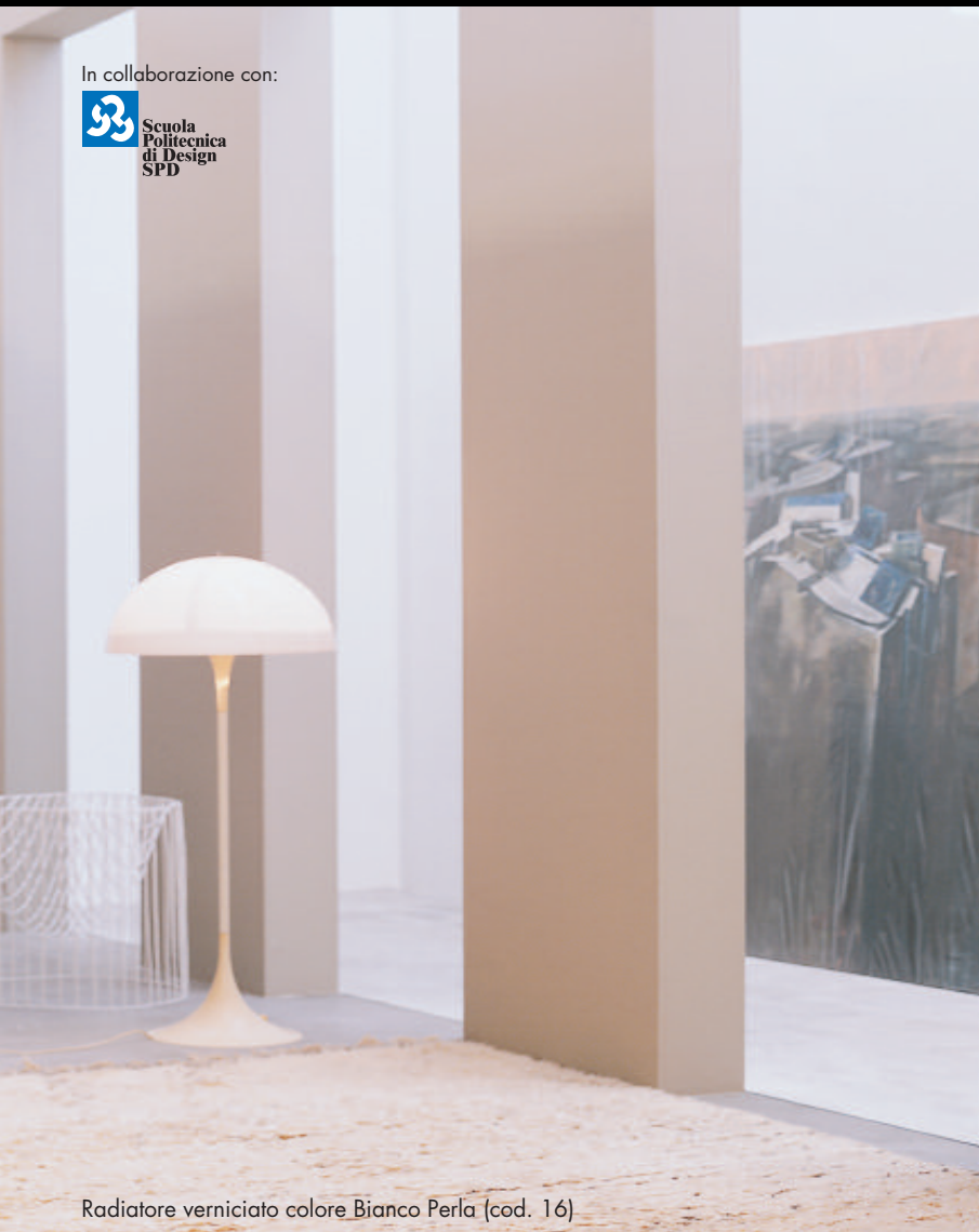
Radiatore verniciato colore Bianco Perla (cod. 16)