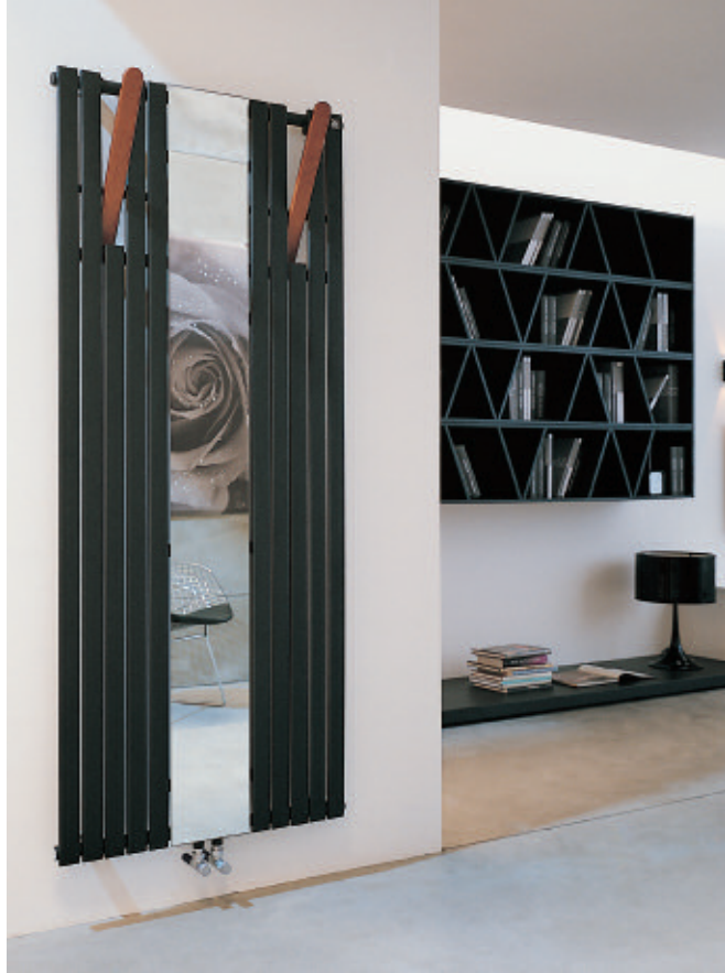
In foto: Radiatore Flexo 2. Altezza mm 1820, larghezza mm 788, colore Nero satinato (cod. 30).