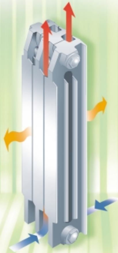
Doppia piastra termoconvettiva

Grazie al suo disegno, Jolly ha un'efficienza superiore a quella degli altri radiatori di ghisa. Questo vantaggio spiega perché Jolly, pur diffondendo la stessa quantità di calore degli altri radiatori di ghisa, è decisamente più sottile. Spessore ridotto significa meno ingombro, migliore integrazione negli spazi abitativi, meno vincoli per l'arredamento. Jolly è un radiatore di qualità perché viene rifinito con grande cura. La parte a "vista" è perfettamente levigata, senza alcuna imperfezione nel profilo degli elementi.