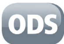
Sistema di controllo ossigeno

Le stufe a gas Qlima sono efficienti e silenziose, non necessitano di ventola per la distribuzione del calore.