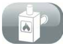
uscita posteriore e superiore