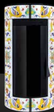
CERAMICA BIANCA Céramique Blanche