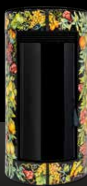
CERAMICA NERA Céramique Noire