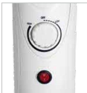
Termostato regolabile Indicatore luminoso di funzionamento