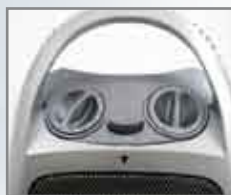
Selezione 2 potenze Funzione ventilazione