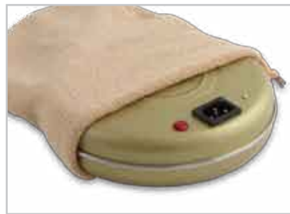
Custodia di stoffa