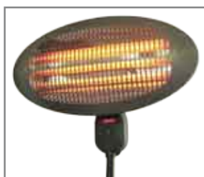
Pannello radiante con 3 tubi al quarzo