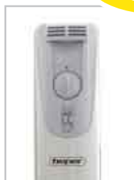
Selezione 2 potenze Termostato regolabile