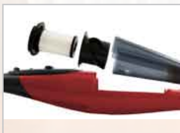
4 stadi di filtrazione Filtro hepa