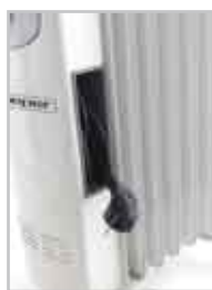
Pratico avvolgimento del cavo