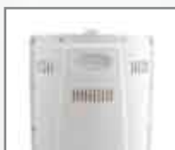
Maniglia per il trasporto