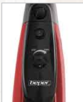
Manopola di regolazione di potenza