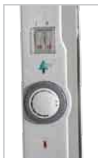
Termostato regolabile Indicatore luminoso di funzionamento