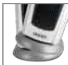
Spegnimento automatico in caso di caduta