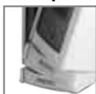
Spegnimento automatico in caso di caduta