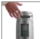
Maniglia per il trasporto