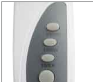
Selezione 2 potenze Timer regolabile