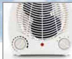
Selezione 2 potenze