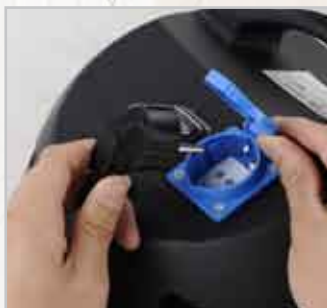
Preso elettrica per elettroutensili

tubo flessibile tubi rigidi (2 pezzi) spazzola per pavimenti bocchetta per angoli e fessure filtro in gommapiuma sacco raccogliipolvere