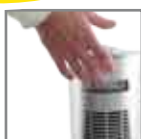
Maniglia per il trasporto