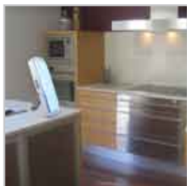
Portatile o da installare a parete