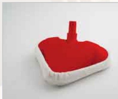
Panno in microfibra lavabile

La forma ad angolo si adatta perfettamente agli angoli di casa. Pulisce ed igienizza qualsiasi superficie in modo facile, veloce e silenzioso