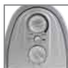
Selezione 2 potenze