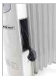
Pratico avvolgimento del cavo