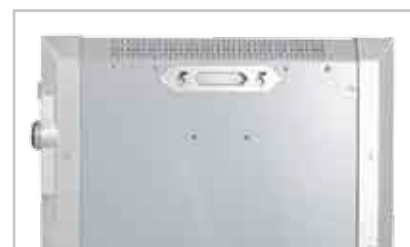
Maniglia per il trasporto