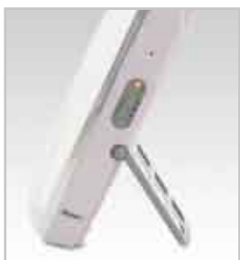
Cavalletto estraibile per appoggio