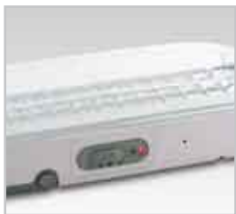
Selettore di intensità luminosa e indicatore di carica