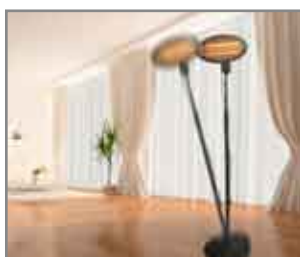
Spegnimento automatico in caso di caduta