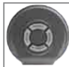
Selezione 2 potenze