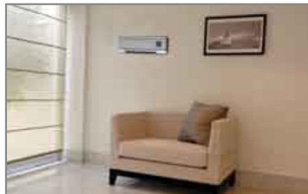
Fissabile a parete