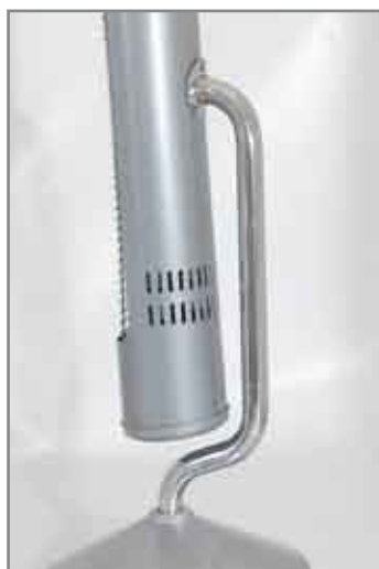
Design elegante e funzionale

GLI ELEMENTI RISCALDANTI IN FIBRA DI CARBONIO HANNO UN'EFFICIENZA ELEVATISSIMA E UN BASSO CONSUMO ENERGETICO