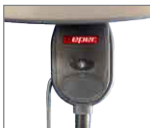
Selezione 3 potenze