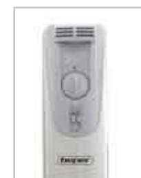
Selezione 2 potenze Termostato regolabile