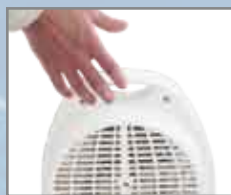
Maniglia per il trasporto