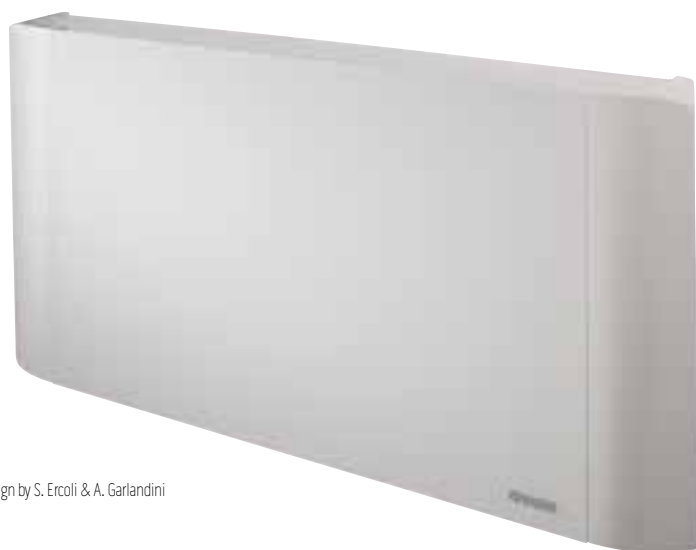
Design by S. Ercoli & A. Garlandini